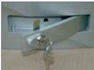
Sblocco con leva di alluminio e serratura di serie metallica