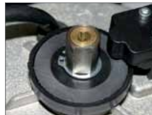
Frizione meccanica bidisco per regolazione della forza (solo per SATURN OIL)