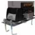
Piastra regolabile con dadi /viti