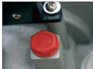
Lubrificazione degli ingranaggi in olio