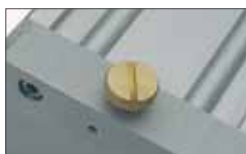
Manual, internal release system. Optional external release with customized key Sistema di sblocco interno manuale. Su opzione sblocco esterno con chiave personalizzata.