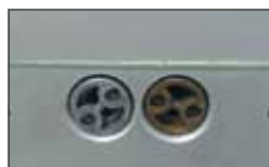
Anti-crushing security thanks to the force adjusting by-pass valves Sicurezza antischacciamento grazie alle valvole by-pass di taratura della forza.