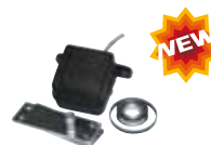
12711064 Rotary encoder Encoder rotativo