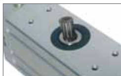
SCUTI M version with internal shaft on request Versione SCUTI M con albero intero su richiesta