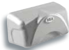
12711055 KOMEGA Carter Carter