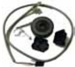
11303005 ENCOM KIT Encoder Encoder