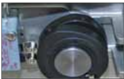
Electronic limit switches