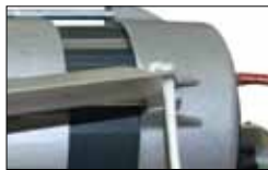
Release system with lever on the operator with cable.

Sistema di sblocco tramite leva posta sull'attuatore con cavo.